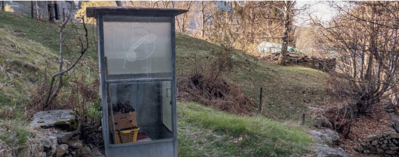
Ausgediente Telefonkabine in einer Siedlung oberhalb von Bellinzona.