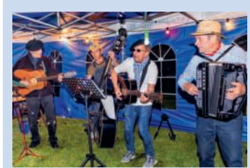
Fetzige Musik ...