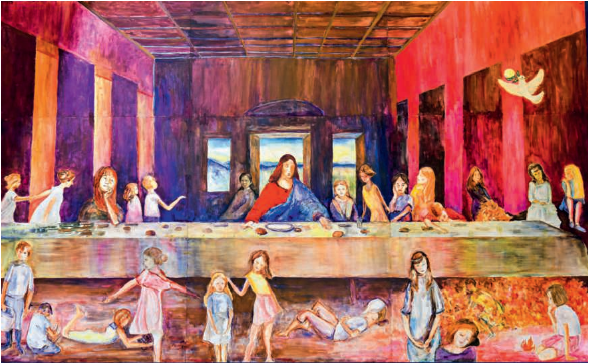
Das Erstkommunionbild 2023 von Röbi Ruckli hat unsere Erstkommunionkinder durch die Vorbereitungen zur Erstkommunion begleitet.