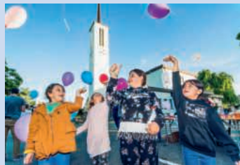
... und fröhliche Kinder an der «Langen Nacht» 2021 im Kanton Aargau.

Eintritt überall frei | Programme auf langenachtderkirchen.ch