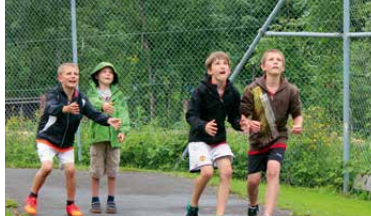
Unsere spannende Äplerolympiade.