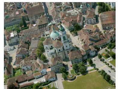
Die Solothurner Kathedrale aus der Vogelschau.

Anmeldung mit Angabe der Anzahl Personen bitte bis 26. August an die Bischöfliche Kanzlei, Baselstrasse 58, 4501 Solothurn, Tel. 032 625 58 41, Fax 032 625 58 45, E-Mail: kanzlei@bistum-basel.ch.