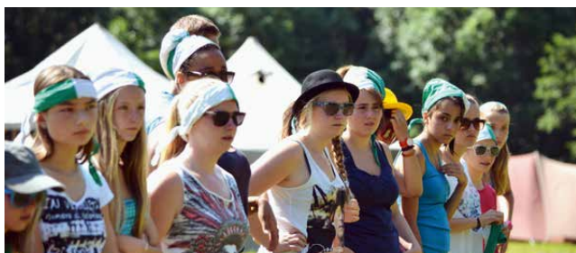
Da wird genau aufgepasst.