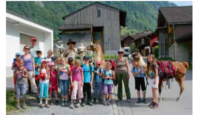
Das traumhafte Lamatrekking.