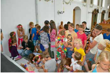
Unser wunderschöner Lagergottesdienst.