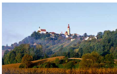
St. Maria am Himmelsberg, Straden.