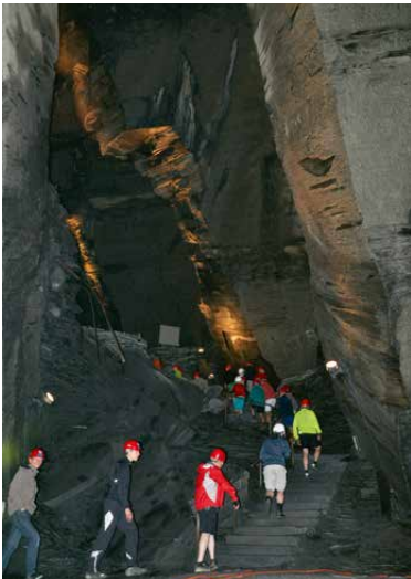
Das imposante Schieferbergwerk.