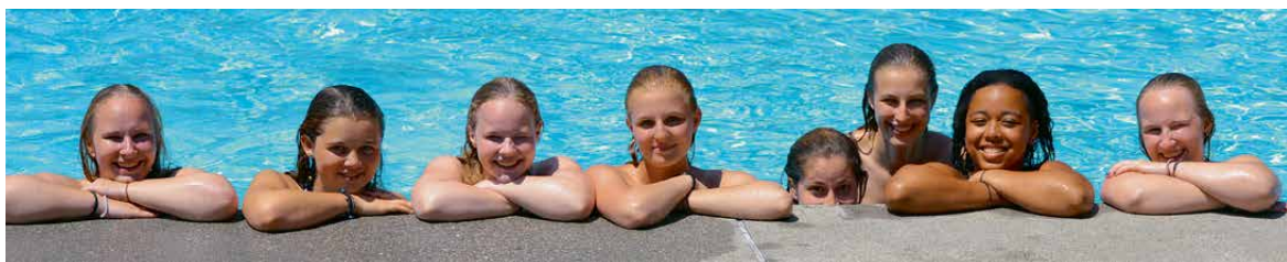
Abkühlen tut gut.