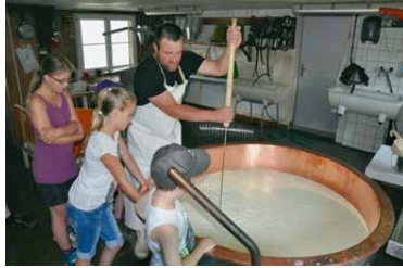
Beim eindrucklichen Alpkäsen.