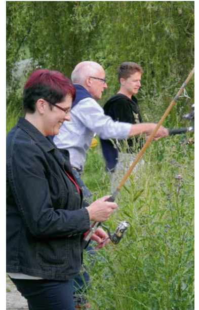
Petri Heil ... Gibt's wohl etwas zu essen?