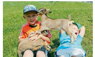
Das härzige Geisslein streicheln.