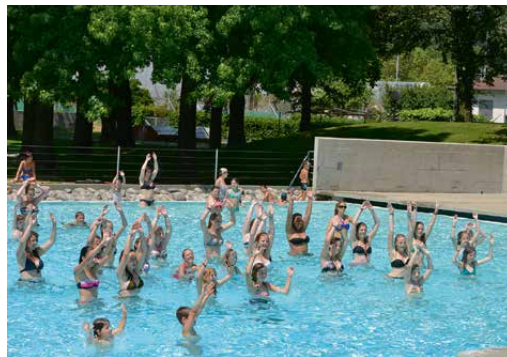
Die Gallier beim Wassersport.