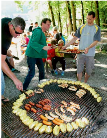
Der feine Grillabend.