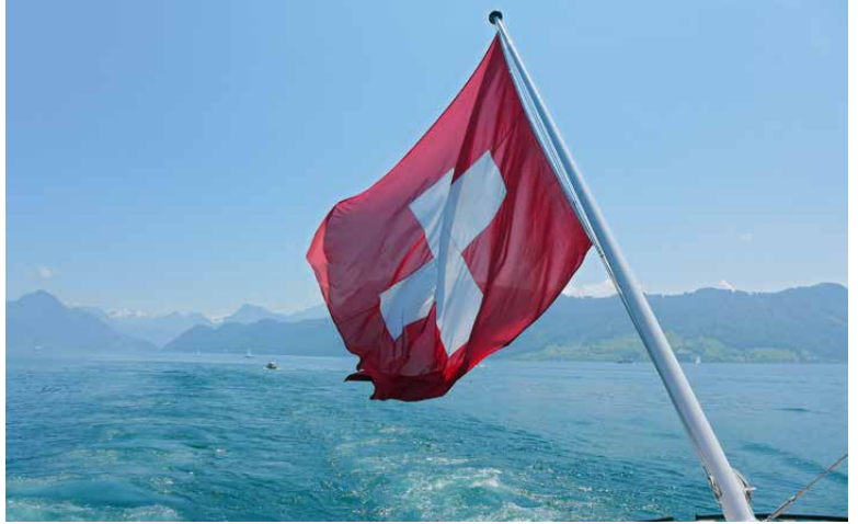
Vaterland pur: Schweizer Fahne auf dem Dampfschiff «Unterwalden».

Das Wort Gott und der persönliche Glaube wird in der heutigen Zeit in politischen Reden eher selten verwendet. Das mag aus Respekt vor der Glaubensfreiheit der Zuhörerschaft so sein oder weil es als nicht mehr zeitgemäss gilt. Solange nicht das Gegenteil behauptet wird, kann ein Verweis auf grundlegende soziale Werte durchaus als christliche Haltung verstanden werden. Beispiels-