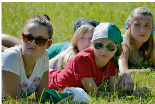
Oh, là, là!