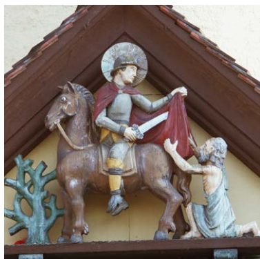
St. Martin teilt seinen Mantel mit dem Bettler.