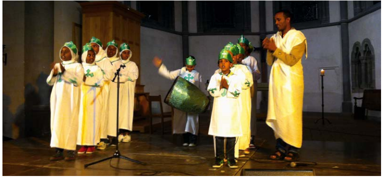
An der nationalen Feier zur Woche der Religionen 2014 in Lausanne.

So, 8.11., 17.00, Pfarrkirche St. Katharina, Horw, Kollekte, www.musikkathhorw.ch