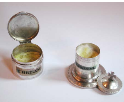
Chrisamöl und Chrisamsalbe.