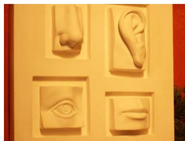
Die vier Sinnesorgane: Nase, Ohren, Augen und Mund.