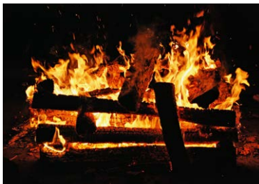
Der Laternenumzug endet am Feuer beim Pfarreiheim.