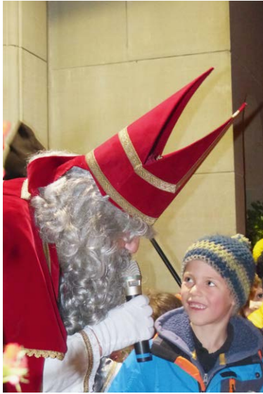
Kannst du mir ein Gedicht aufsagen?