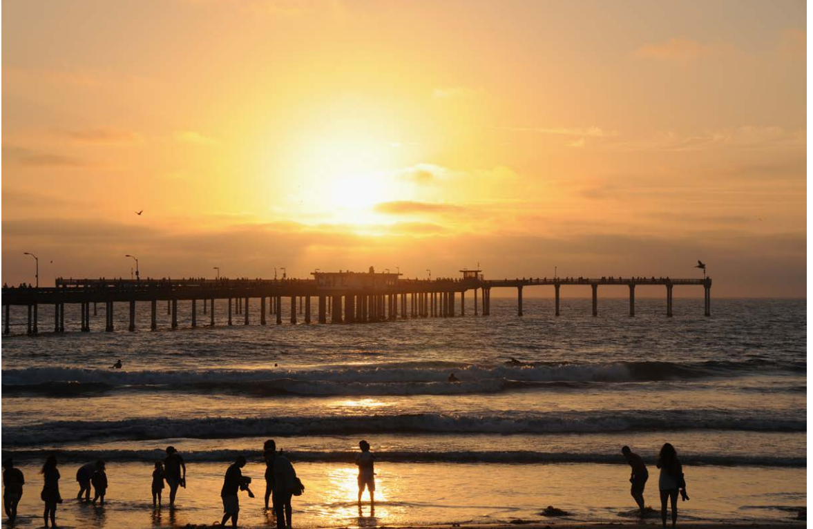
San Diego USA, August 2014.

Von anderen Menschen, von dem wir hören, den wir sehen, mit dem wir zusammenkommen, machen wir uns ein Bild – und auf dieses Bild nageln wir ihn fest. Meistens ist das Bild, das man sich ausgedacht hat, falsch. Meistens kennt man ihn gar nicht näher. Es genügt, dass er zu einer anderen Gruppe, einer anderen Richtung oder Partei, einer anderen Rasse oder Religion angehört. Er steht auf der andern Seite.