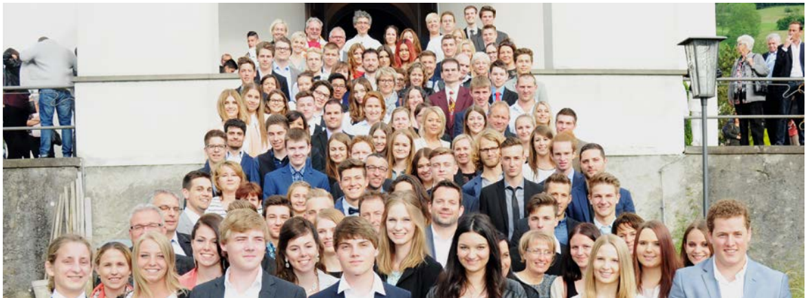
Gesamtfoto nach der Firmung vom 30. Mai.