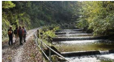
Wanderweg an der Lorze.