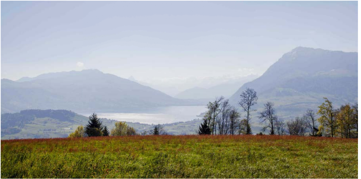
Blick von der Kapelle Michaelskreuz Richtung Rigi und Zugersee.