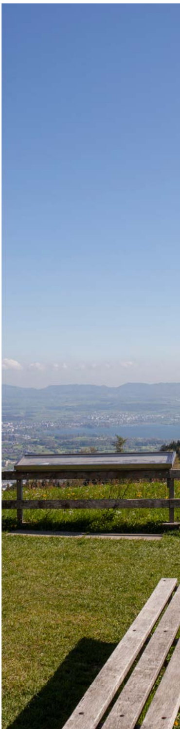
Aussicht mit Bergübersicht hinter der Michaelskreuzkapelle.