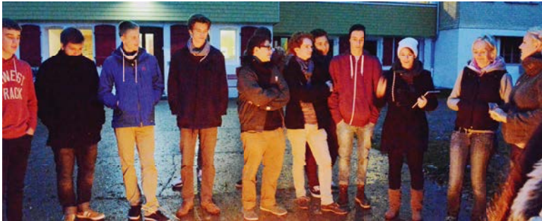
Nach der Besinnung am Feuer im Firmweekend.