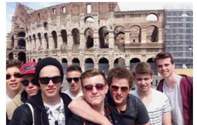
Auf der Firmreise nach Assisi hat uns allen auch der Ausflug nach Rom gut gefallen.