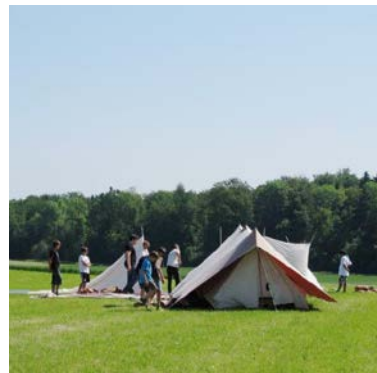
Zeltlager Pfadi Root.