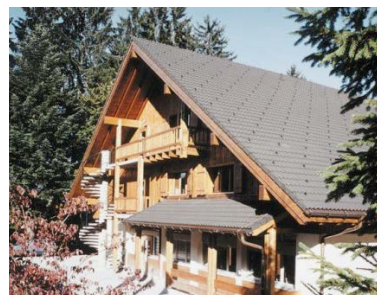
Das Lagerhaus des Pfarreilagers in Moléson-sur-Gruyères.

Wir wünschen allen Lagerteilnehmenden unfallfreie und unvergessliche Lagertage. Sommerzeit – dem Leben Raum geben!