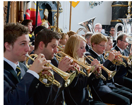
Das Cornetregister der BB MG Root an ihrem letzten Kirchenkonzert.