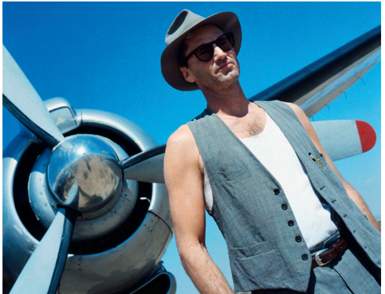
«Homo faber» scheitert an seinem fixen Weltbild.

Meisterhaft spitzt Frischs späte Erzählung «Der Mensch erscheint im Holozän» die Frage nach der Stellung des Menschen zum Widerstreit zwischen Genesis und Geologie zu. Für die gedächtnis- und teilnahmele Natur ist der Mensch vollkommen unerheblich – jeglicher religiöse Sinn, wie ihn die biblische Schöpfungserzählung verbürgt, die der alte Herr Geiser an die Wand pinnt, verflüchtigt sich angesichts der Kälte und Gleichgültigkeit des Univer-