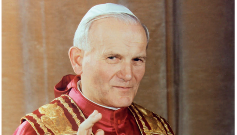
Beginn des 26-jährigen Pontifikats: Papst Johannes Paul II.

Die Feierlichkeiten der Seligsprechung beginnen mit einer «Vigil» am Samstag, 30. April, um 20.30 Uhr im