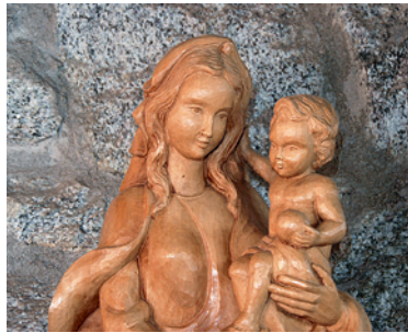
Maria mit Kind in der Kapelle Michaelskreuz.