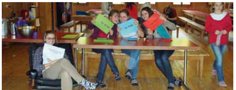
Wer hat die richtige Antwort bei 1, 2 oder 3?