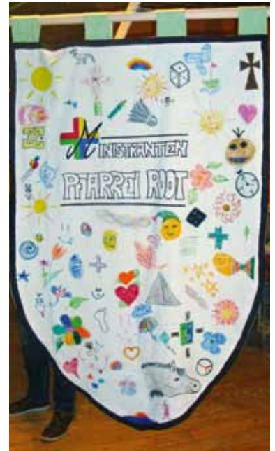
Unsere neu entstandene Fahne