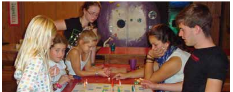
Das beliebte Leiterliedspiel am Samstagabend