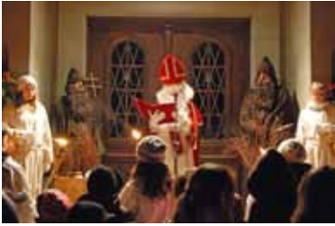
Samichlauseinzug in Root

Der Samichlaus zieht mit seinem Gefolge in unser Land ein.