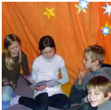
Kinder geniessen das Erzählzelt.

Viele von Ihnen erinnern sich sicher noch an das Zelt, das im letzten Advent im hinteren Teil der Kirche stand.