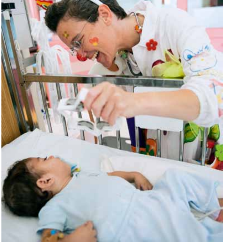
Durch Clown-Therapie Unsicherheiten der Kinder abbauen

Oft kommen die Mütter mit ihren Kindern von sehr weit her in das Spital, um sich helfen zu lassen. Die neu erweiterte Mütterschule ermöglicht einen intensiven Einbezug der Mütter in die Pflege ihrer Kinder und gibt wertvolle Tipps für Erste-Hilfe-Massnahmen und Prävention von Krankheiten. So bietet das Spital eine umfassende und nachhaltige