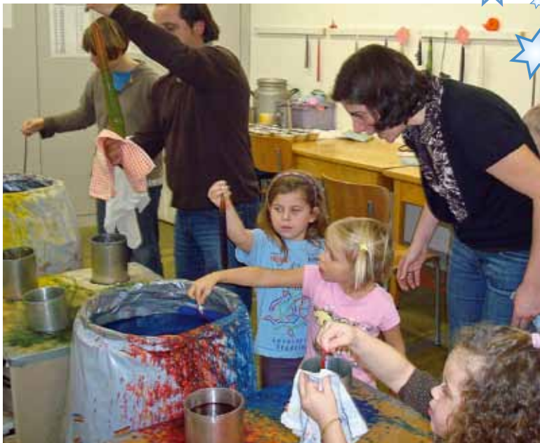
Gross und Klein liebt das Kerzenziehen.