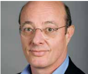
Louis Schelbert, Nationalrat

«Enorm getroffen hat mich der Tod eines jungen Bekannten im Alter unserer Kinder. Die Geburt eines Kindes in der Verwandtschaft ist mir ebenfalls sehr nahegegangen.» (Louis Schelbert)