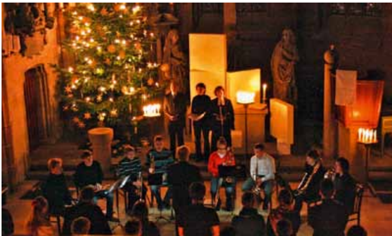
Stille Nacht, heilige Nacht: Rituale gehören zum Fest.

Eine besondere Menschlichkeit finde ich bei Künstlern. Sie trauen sich, der ganzen Welt ihre tiefsten Gedanken, Emotionen und Inspirationen durch ihre Werke zu zeigen.» ( Bianca Sissing Loetscher )